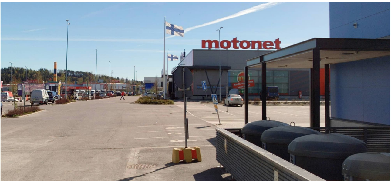
Korttelin rakennusten pohjoispuolen julkisivujen linja. Näkymäkuva kohti suunnittelualueetta lännestä 2024.