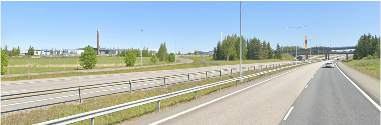
Näkymä valtatieltä 4 pohjoiseen, suunnittelualue sijaitsee aivan kuvan vasemmassa laidassa (Google 2023).

Kaava edistää elinkeinoelämän toimivan kilpailun kehittymistä alueella mahdollistamalla liiketoiminnan suunnitellut muutokset ja laajennukset.