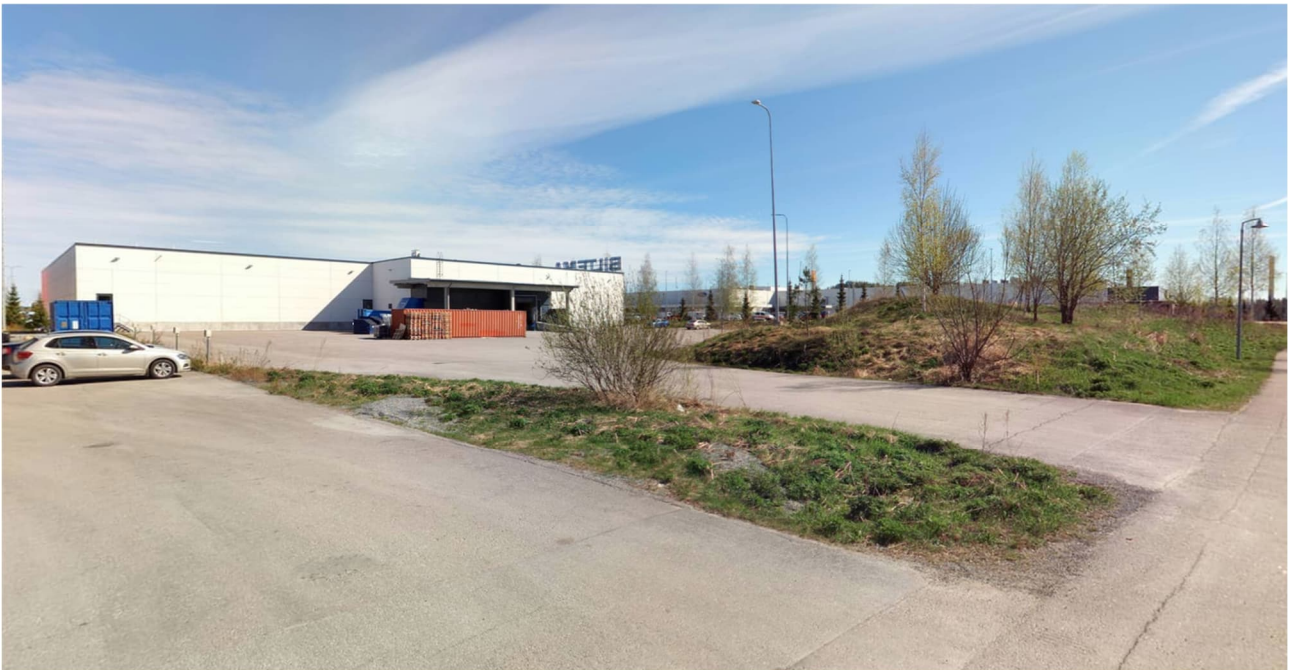
Näkymä suunnittelualueen eteläosaan Miekkiöntieltä vuodelta 2024.

Kaavalla ei ole olennaisia vaikutuksia luonnonympäristöön johtuen tontin rakennetusta nykytilasta. Kaavan lähiympäristössä ei ole tiedossa olevia ja herkästi häiriintyviä luontokohteita. Kaava edellyttää asiakaspysäköintialueen jakamista osiin istutuksin, mitä nykytilanteessa ei ole toteutettu.