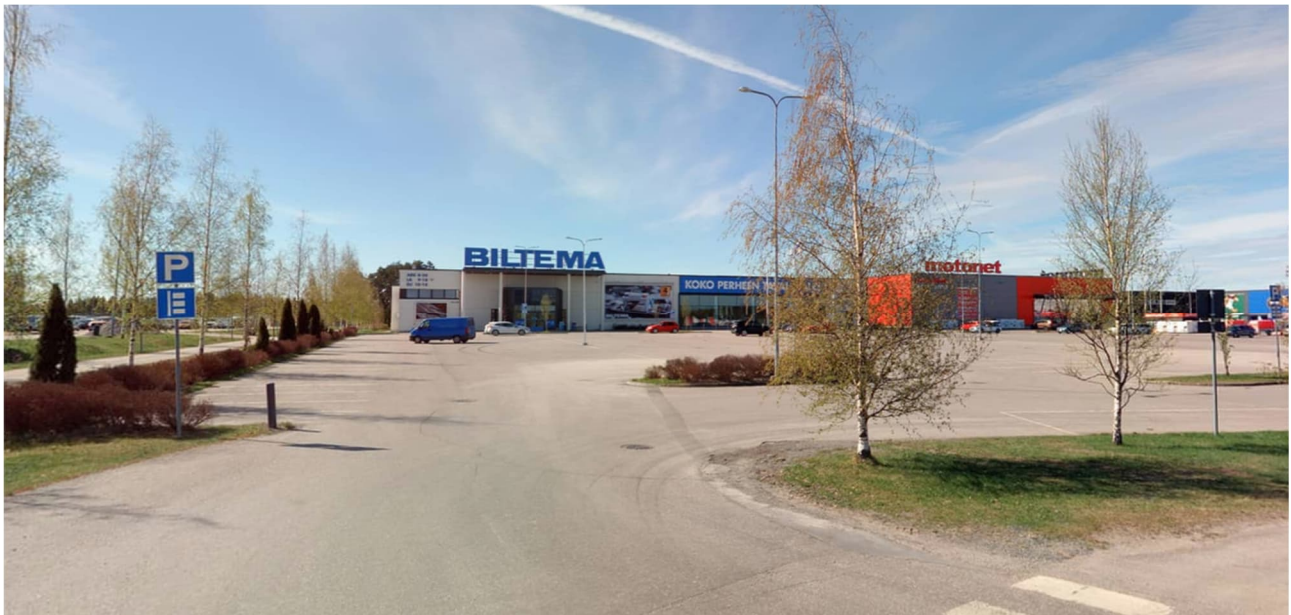
Näkymä suunnittelualueen pohjoisosaan Myyntimiehenkadulta vuodelta 2024.

Muilta osallisilta ei luonnosvaiheen kuulemisessa tullut lausuntoa tai mielipidettä.