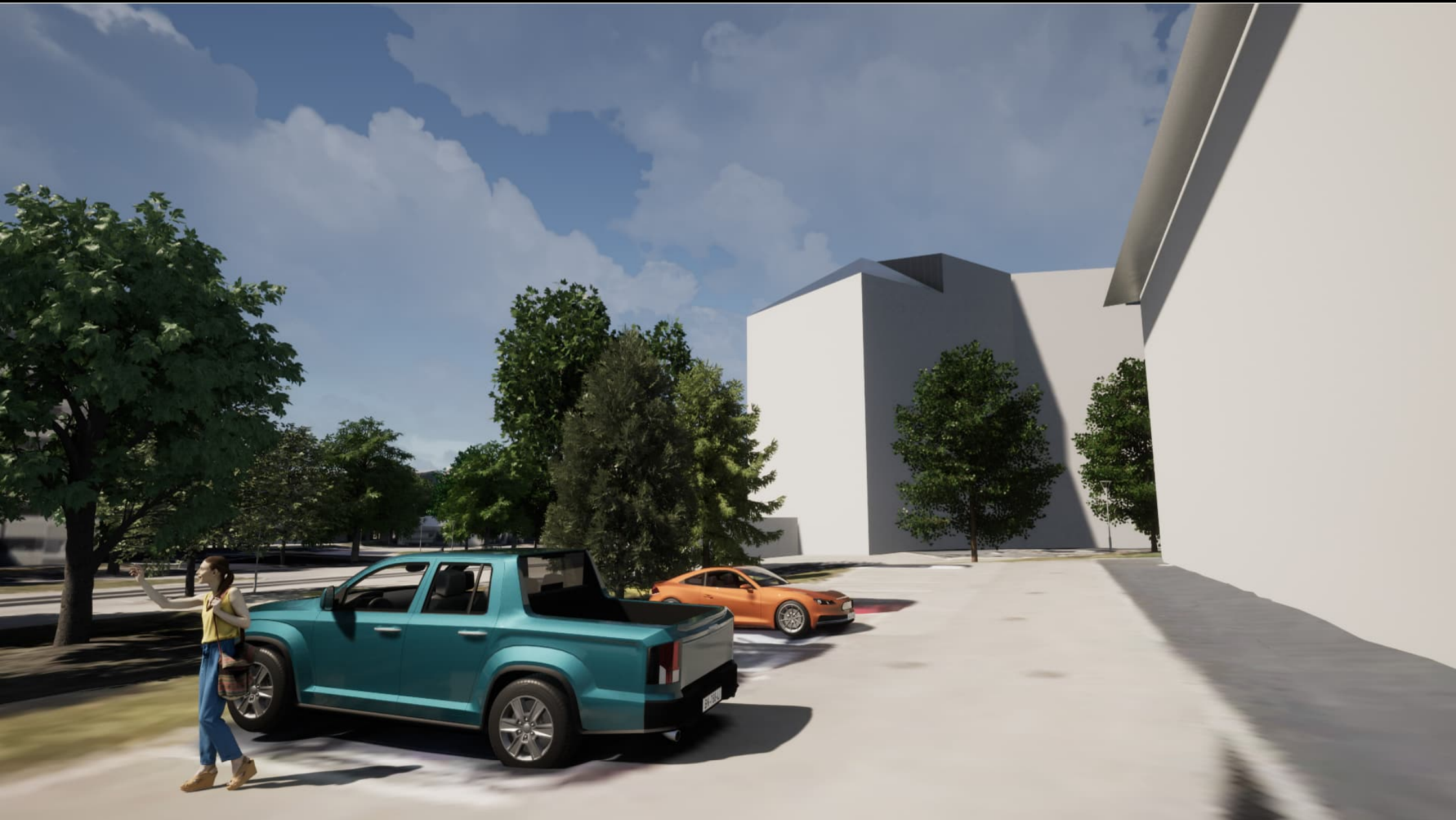
Näkymä idän puoleiselta naapuritontilta