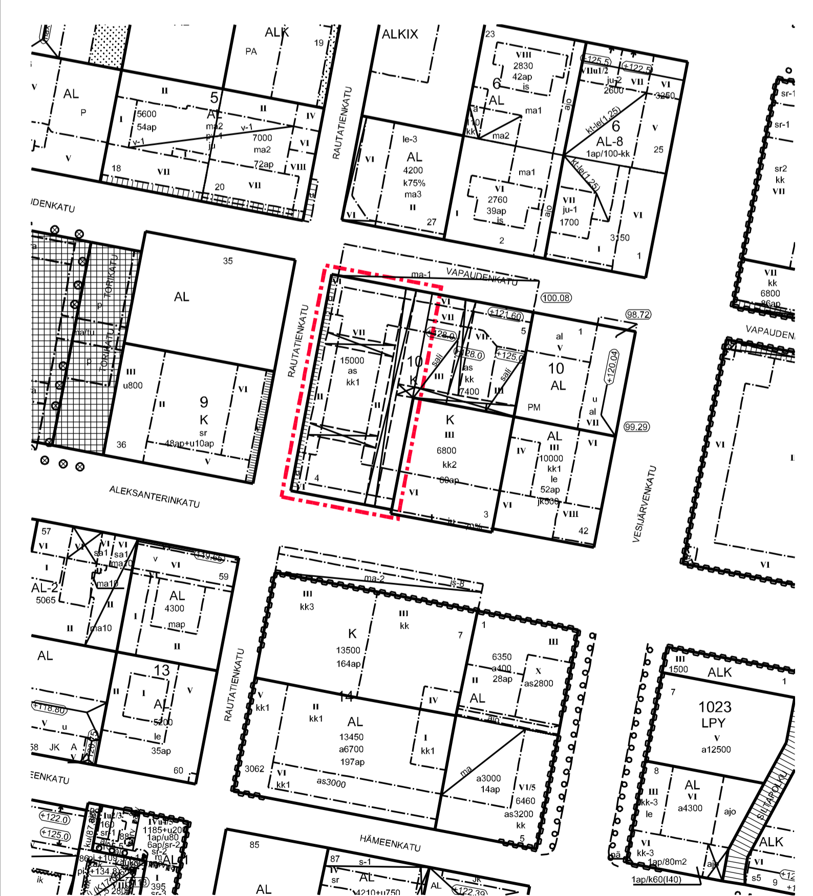
POISTOKARTTA MK 1:1500