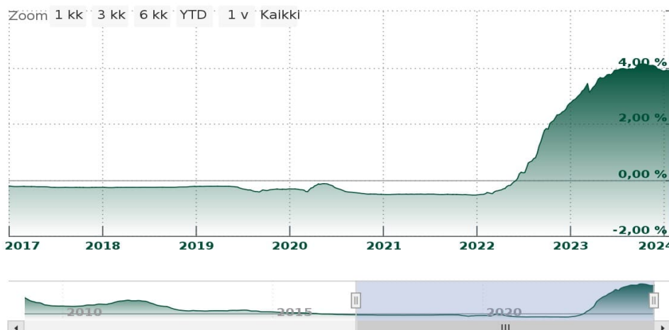
Korkohistoria - EURIBOR6M - 2024/01/23

Vuodelta 2024 talousennusteet ovat laskeneet Suomen osalta. Suomen Pankin 3 , Valtiovarainministeriön 4 ja Kuntarahoituksen 2 ennusteiden mukaan Suomen BKT supistuu vuonna 2023 0,5 prosenttia. Vuoden 2024 osalta Valtiovarainministeriö ennustaa, että Suomen BKT kasvaa 0,7 prosenttia. Samalla Suomen Pankki ja Kuntarahoituksen ennusteet odottavat Suomen BKT:n supistuvan vuoden 2024 aikana 0,3-0,5 prosenttia. Ennusteiden perusteella Suomen talous kääntyy kuitenkin kasvuun vuoden 2025 aikana. Kuitenkin suhdannebarometrit viittaavat siihen Suomen talousnäköymän 2 olevan asteittain vakautumassa eikä taantumien odoteta enää syvenevän.