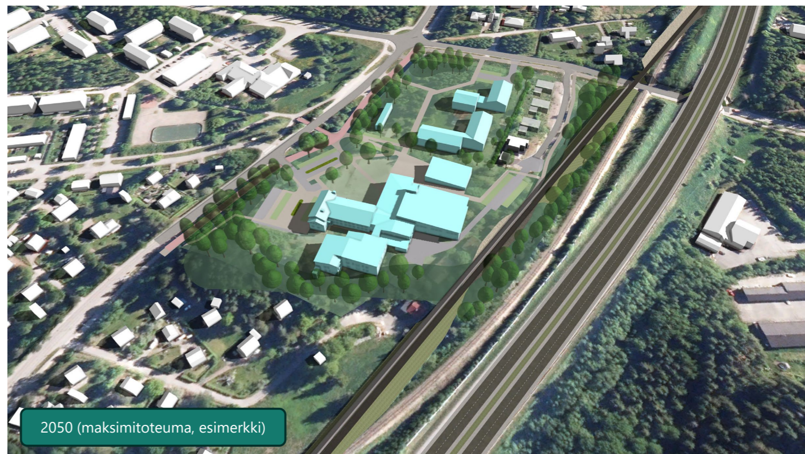
2050 (maksimitoteuma, esimerkki)