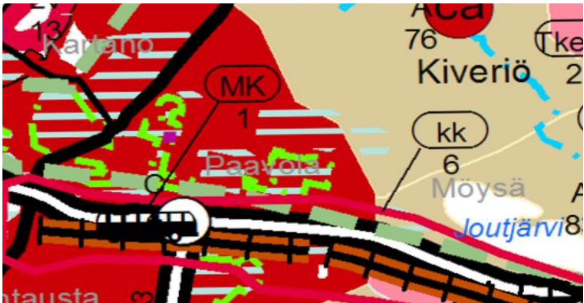
Ote Maakuntakaavasta 2014.

Aleksanterinkadun asuin- ja liikerakennukset sisältyvät Päijät-Hämeen maakuntakaavan kulttuurihistoriallisesti arvokkaiden kohteiden luetteloon.