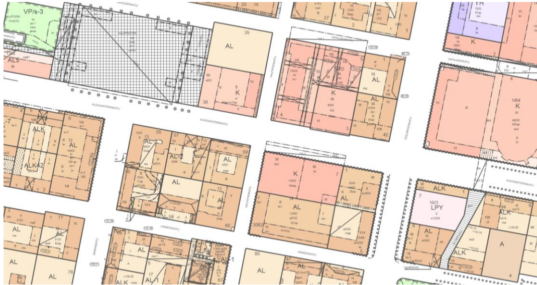
Ote Ajantasa-asemakaavasta (20.2.2020).

- K-aluetta, eli liike- ja toimistorakennusten korttelialuetta