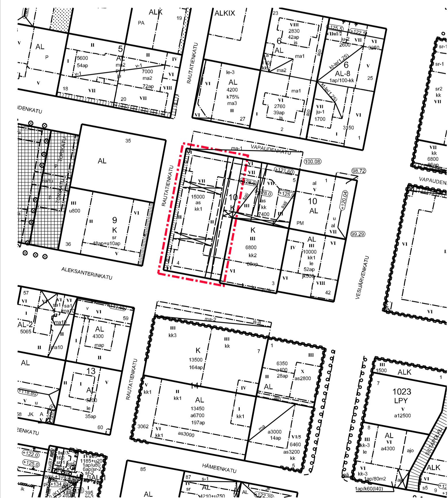
POISTOKARTTA MK 1:1500