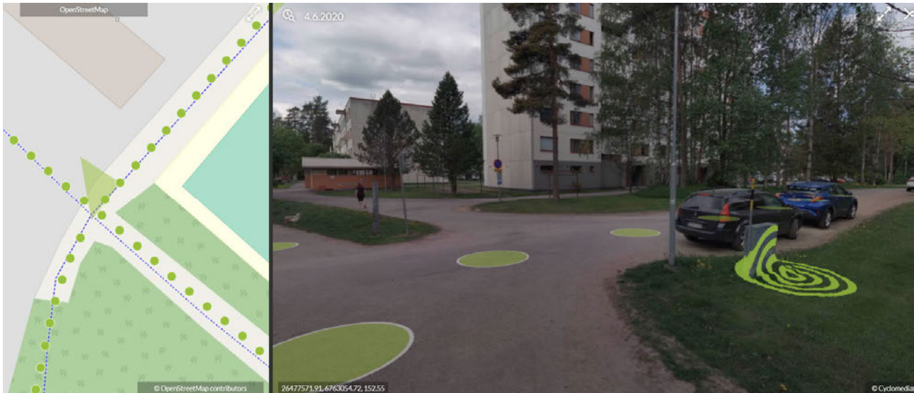
Kuva 1. Katukuva v. 2020 puistokäytävältä.

Tontilla sijaitsee kaksi erillistä kerrostaloa ja toisen kerrostalon pysäköintialueelle kulku on rakennettu toisen kerrostalon sisäänkäyntiovien edustalta. Valjaskatu 2 C ja D talon pysäköintialueelle ajoneuvolla ajo on mahdollistettu puistoalueen kautta.