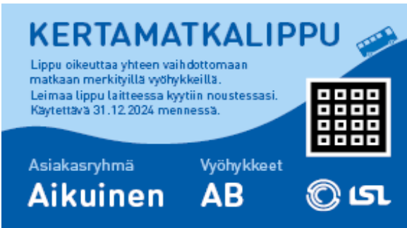
Mallikuva paperisesta kertamatkalipusta.

Lahden seudun liikenteessä on käytössä paperisia kertamatkalippuja, joita asiakas voi saada esim. hyvityksenä tai joita voi olla käytössä esim. kouluilla.