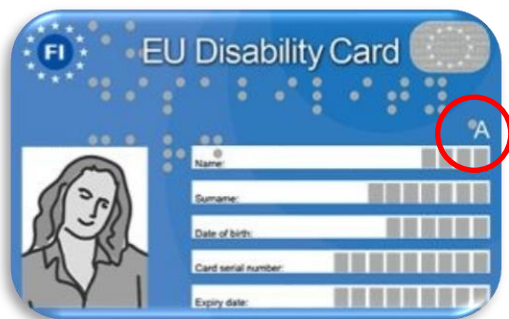
Mallikuva EU:n vammaiskortista A-merkinnällä.