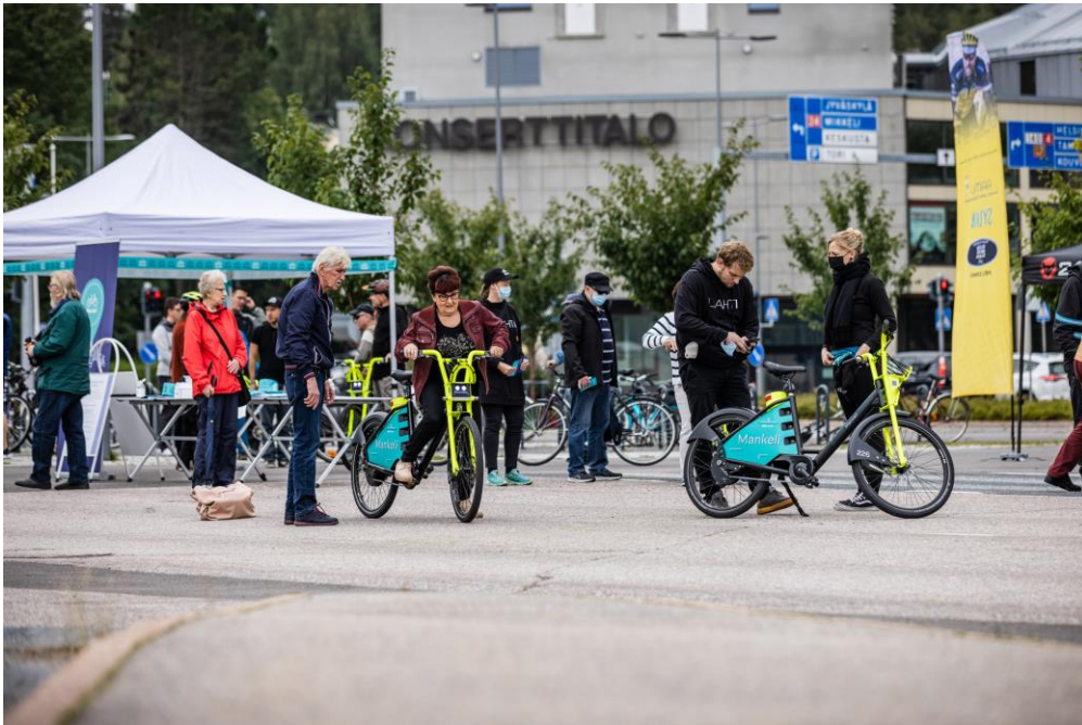
Kaupunkipyörät Mankelien koeajotapahtuma kiinnosti kaupunkilaisia. Kaupunkipyörien pilottikauden käyttäjäkyselyyn vastanneet (N=505) kaupunkilaiset pitivät palvelua erinomaisena.

Joukkoliikennettä täydentävä kaupunkipyöräjärjestelmä Mankeli otettiin käyttöön syyskuussa 2021. Kesällä 2023 kaupunkipyörien määrä tuplaantui: Mankeleita on käytössä 500 ja asemia 62.