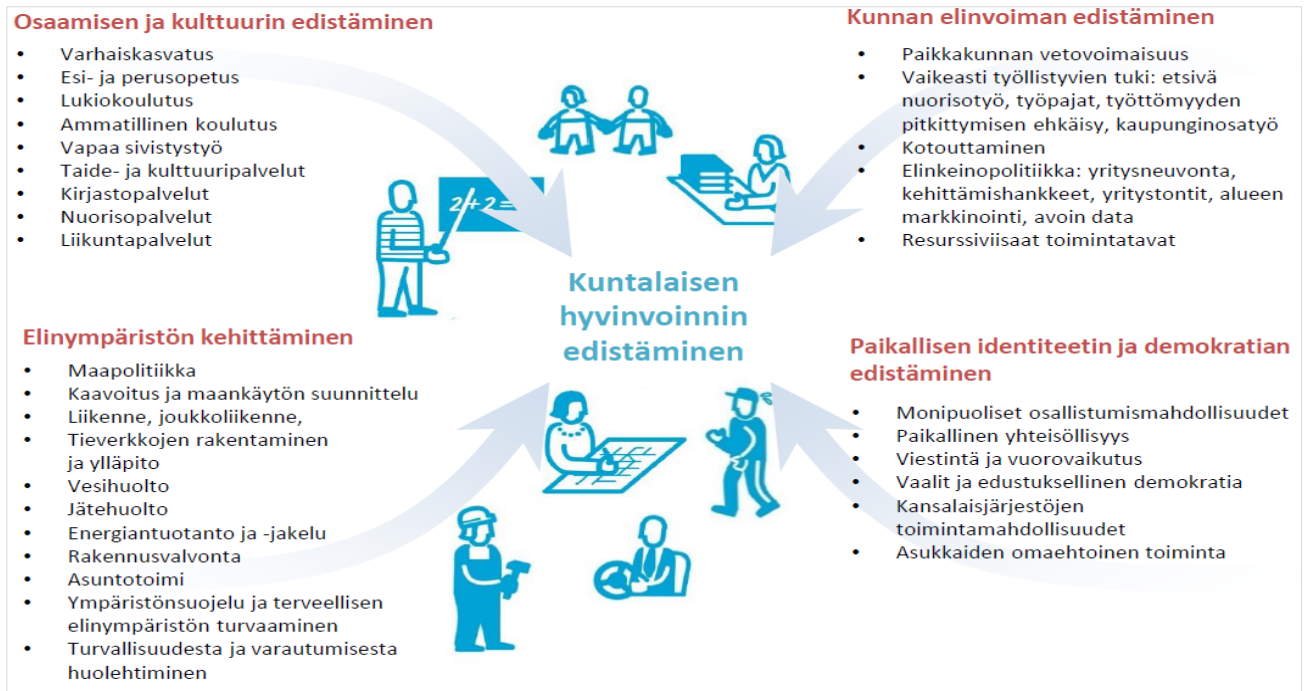
Kuva 2. Kuntalaisen hyvinvoinnin edistäminen. Kuntaliitto.

Maakunnallista yhteistyötä ikäihmisten hyvinvoinnin edistämiseksi ja hyvien käytäntöjen löytämiseksi tehdään kaikkien Päijät-Hämeen kuntien kanssa. Tätä yhteistyötä koordinoi Päijät-Hämeen hyvinvointikuntayhtymä, jatkossa 1.1.2023 alkaen Päijät-Hämeen hyvinvointialue. Hyvinvoinnin ja terveyden edistämistyötä tehdään myös yhteistyössä yhdistysten, järjestöjen ja yritysten kanssa. Kaupunki myöntää vuosiaavustuksia hyvinvoinnin ja terveyden edistämisen sekä osallisuuden lisäämisen käyttötarkoituksiin. Yhdistyksillä ja järjestöillä on mahdollisuus hakea vuosiaavustuksia vuosittain maaliskuussa. Yhteistyökumppaneita ikäihmisten palveluiden järjestämiseen on haettu myös yritystoimijoista, mistä esimerkkinä senioreiden digikinkerit, jotka ovat toimineet menestyksekkäästi jo vuodesta 2018.