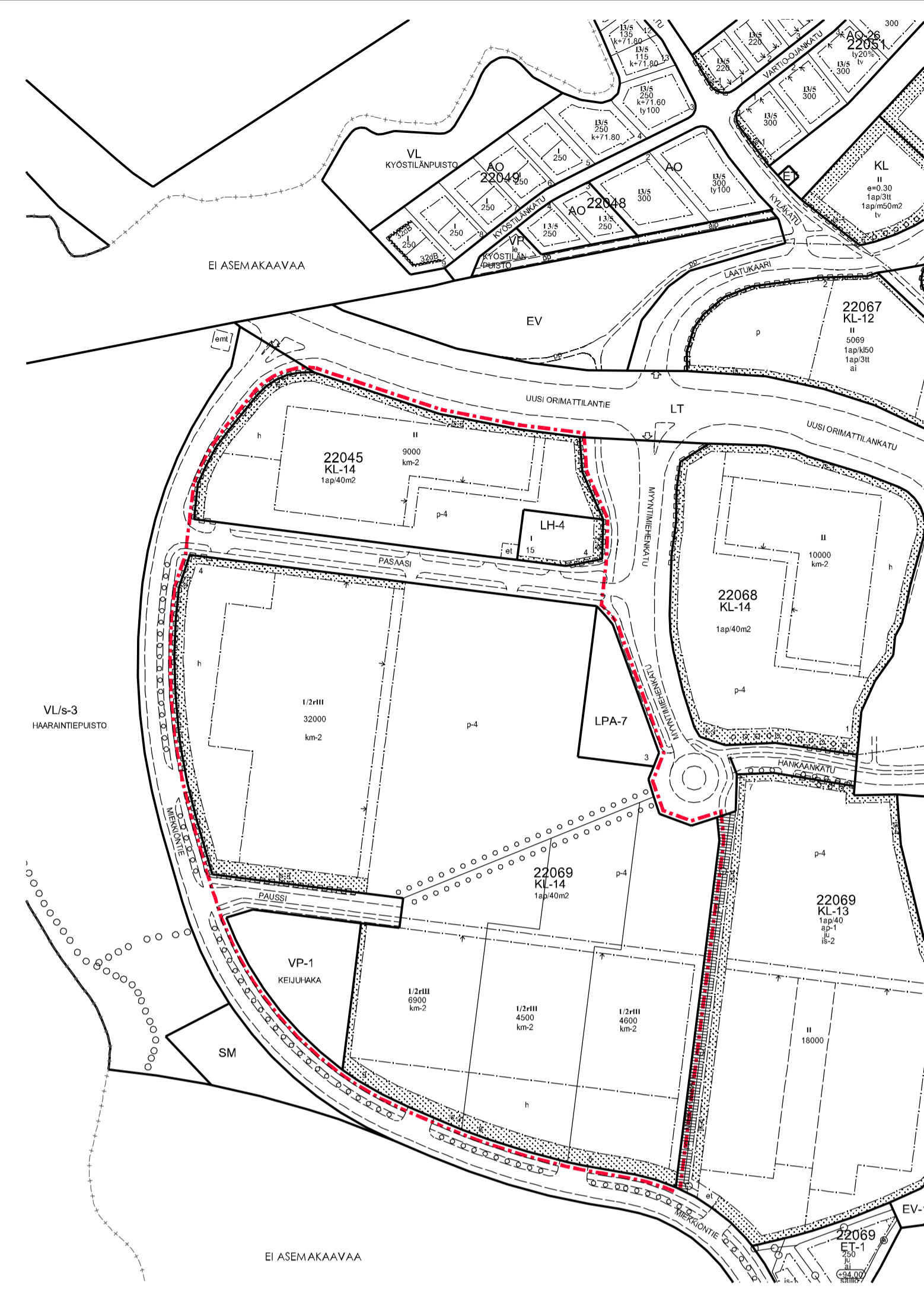
POISTOKARTTA MK 1:3000