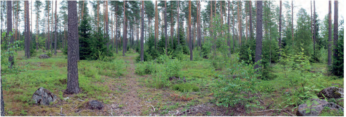
Suunnittelualan itäosaa. Kuva lounaasta.