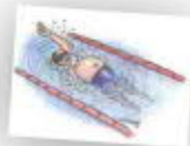
Taulukko 2. Lahden uimahallien aukioloajat vuonna 2022

LAHTI Lahti on ainoa Lahti ja tulo uimataksi