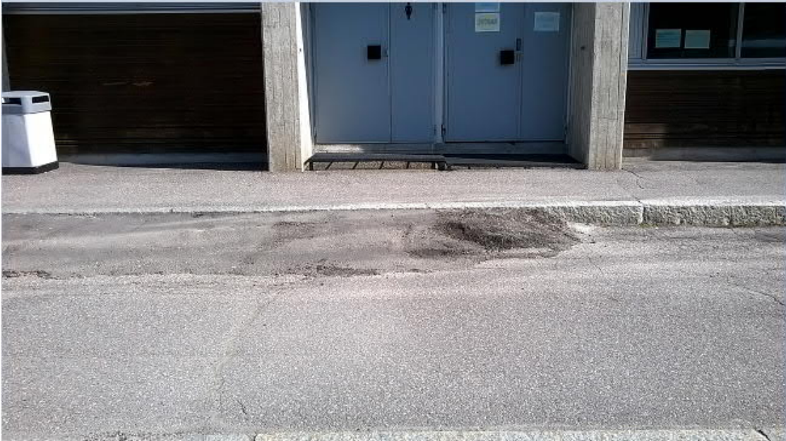
Kuva 2. Liikuntarajoitteisten kannalta kulkeminen on erittäin hankalaa. Kuva liikuntatilojen edustalta.

Lahden Urheilukeskuksen Mäkikatsomon liikuntatilojen edustat, tilanne 1.9.2022.