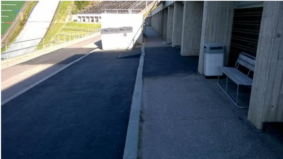
Kuva 3. Kuva liikuntatilojen edustalta. Huom. 3-tasoisuus.