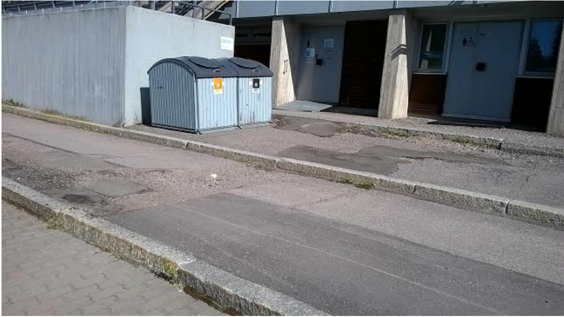
Kuva 4. Kuva Liikuntatilojen edustalta. Huom. 3-tasoisuus.

Edellä esitettyjen kuvien perusteella on helppo havaita, että Mäkikatsomon pukuhuone- ja liikuntatilojen esteettömyyden ja saavutettavuuden parantaminen on aiheellista tehdä. Lahden kaupunki on saanut 31.5.2021 Etelä-Suomen aluehallintovirastolta 62 000 euroa valtionavustusta Lahden mäkikatsomon liikunta- ja pukuhuonetilojen edustojen esteettömyyden parantamishankkeen toteuttamiseen.