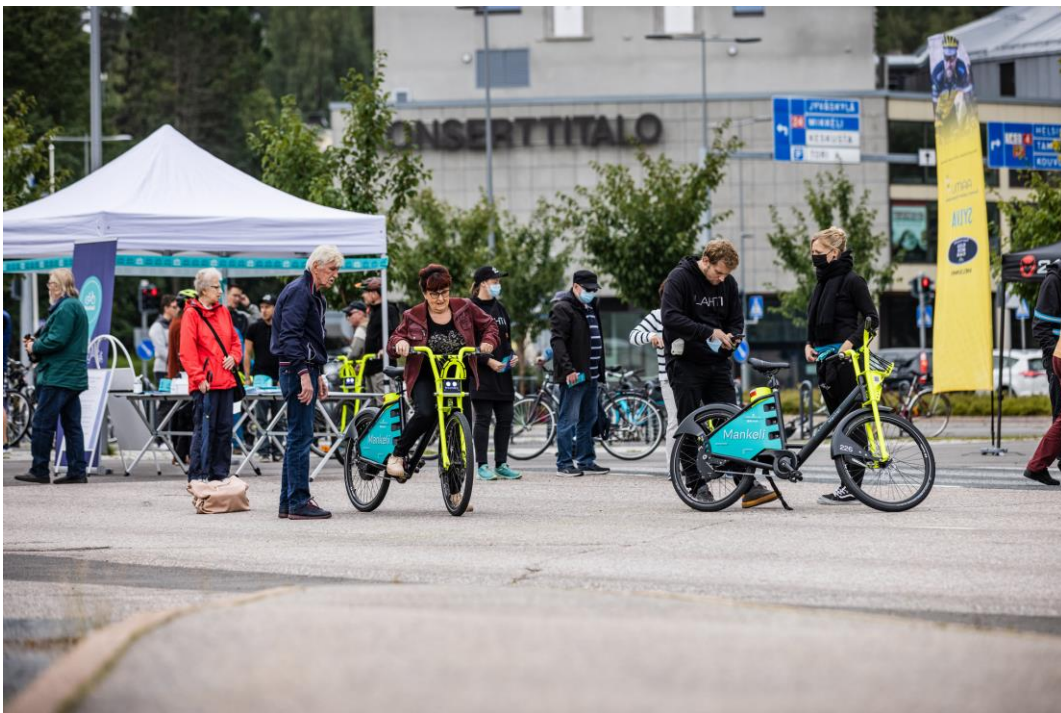
Kaupunkipyörät Mankelien koeajotapahtuma kiinnosti kaupunkilaisia. Kaupunkipyöräilyn pilottikauden käyttäjäkyselyyn vastanneet (N=505) kaupunkilaiset pitivät palvelua erinomaisena.

Joukkoliikennettä täydentävä kaupunkipyöräjärjestelmä Lahden Mankelit otettiin käyttöön syyskuussa 2021.