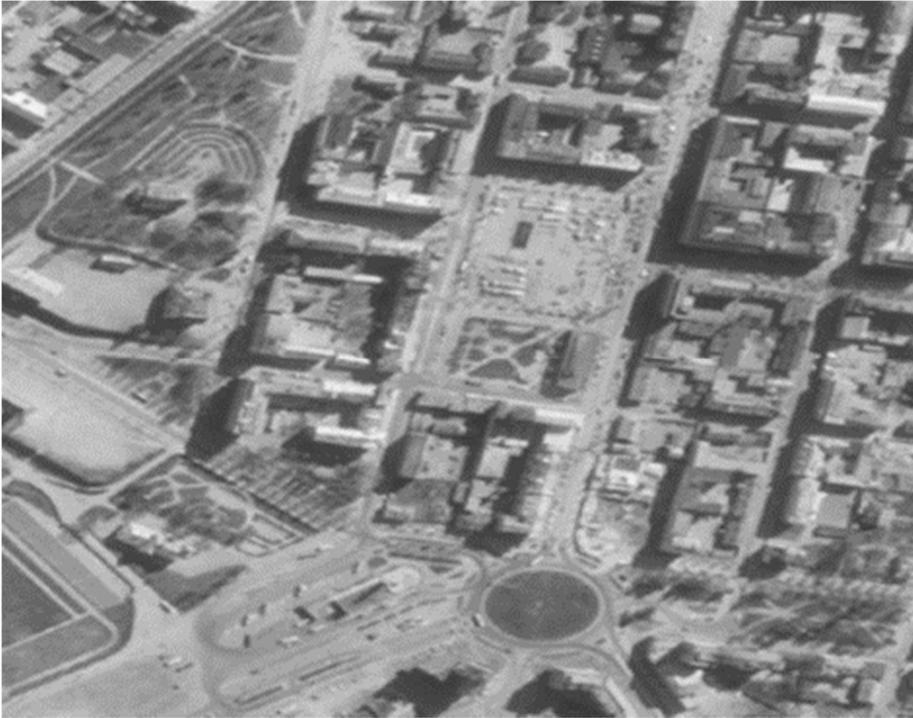
Kuva: Ilmakuva 1960