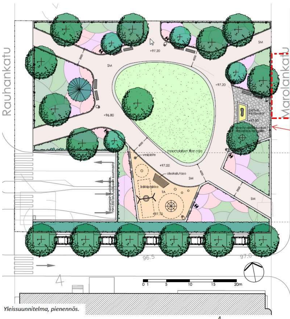
Kuva: Puistosuunnitelman luonnos 2013

Puiston lounaisosaan sijoittuu torinaluspysäköintiin johtava ajoluiska. Pilaantuneiden maiden ennakoitua laajempi puhdistustarve aiheutti "Metro" ravintolan, eli kulttuurihistoriallisesti arvokkaan 1952 rakennetun yleisen käymälän purkamiseen. Tämä mahdollisti torinaluspysäköinnin ajoluiskan laajentamisen sujuvammaksi ja turvallisemmaksi.