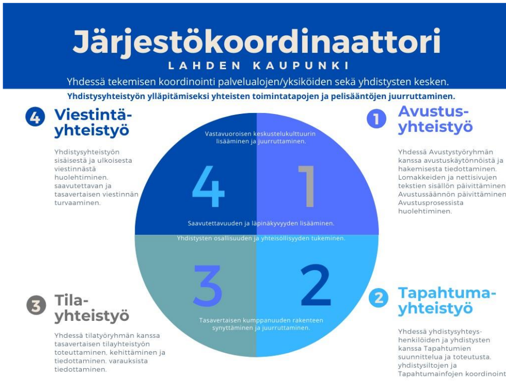
Kuva 1: Järjestökoordinaattorin työnkuvan osa-alueet.