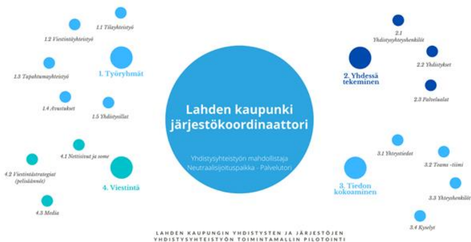
Kuva 2: Järjestökoordinaattorin työnkuva tehtävätasolla.