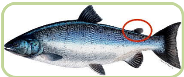
Järvilohi (aina leikattu rasvaevä)