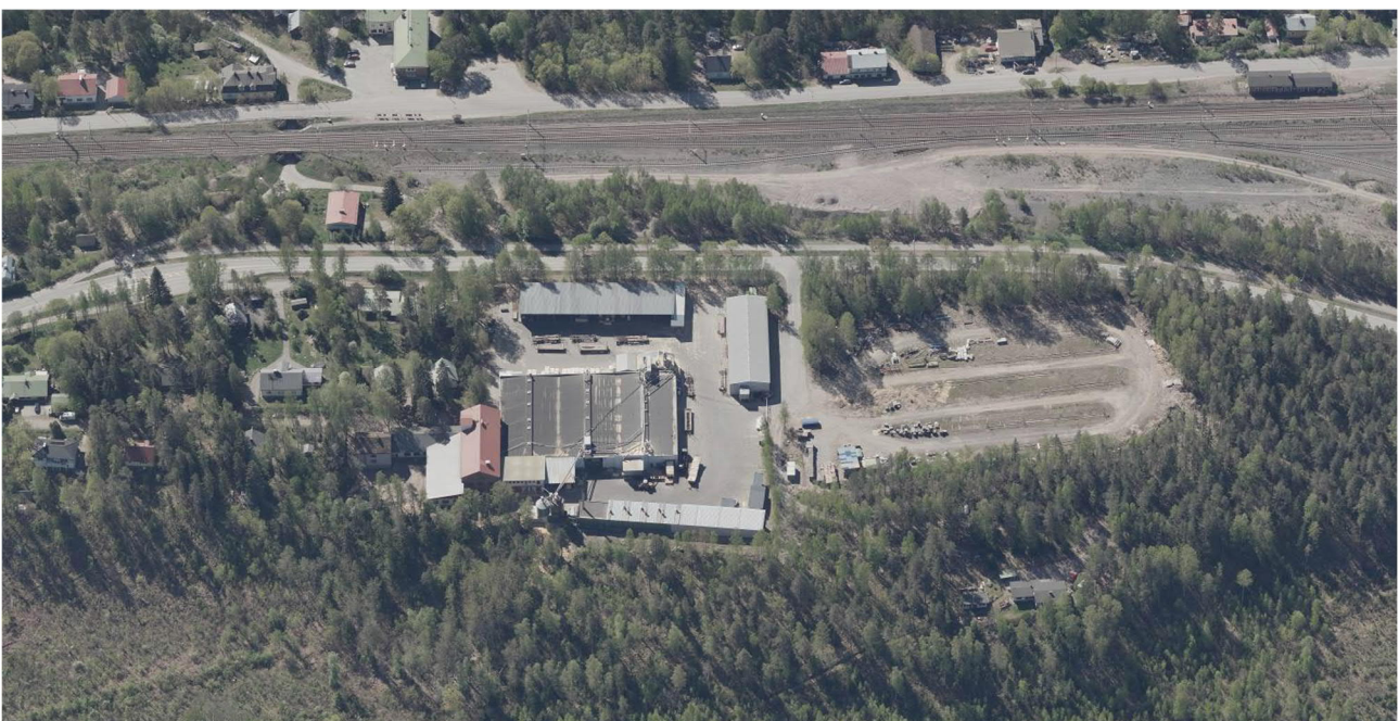
Kuva 5. Viistoilmakuva suunnittelualueesta kohti etelää vuodelta 2019.