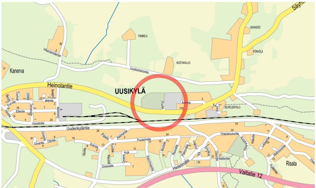
Kuva 1. Suunnittelualueen sijainti kartalla.

Suunnittelualue sijoittuu Heinolantien varteen Puutien ympärille. Suunnittelualue sijaitsee n. 20 km etäisyydellä Lahden kauppatorilta itään.