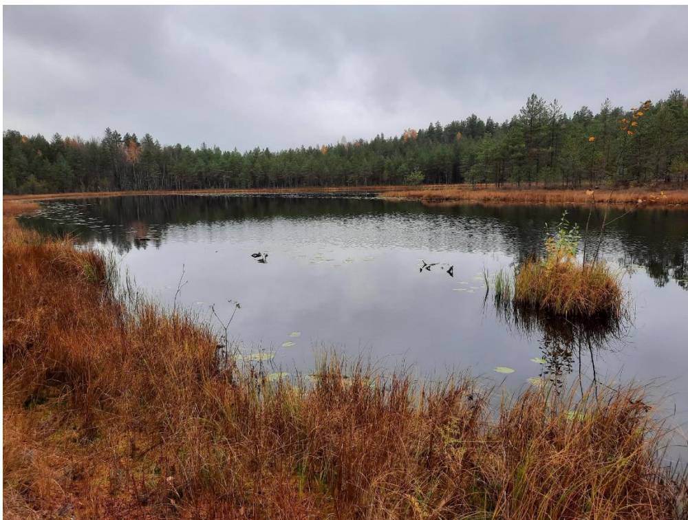
Alueen suurin lampi Hirvilampi.

Valokuvia Hirvilammin suojelualueelta Kuvat 8.10.2021, Mia Honkanen