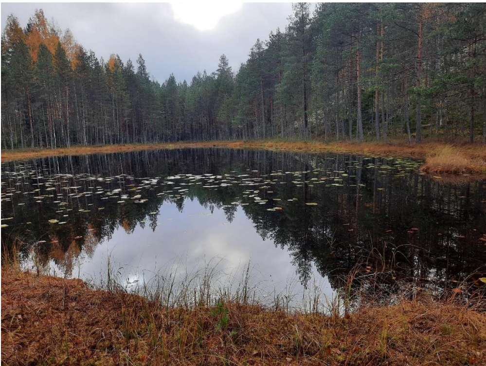
Alueen itäosassa sijaitseva Silmälampi.