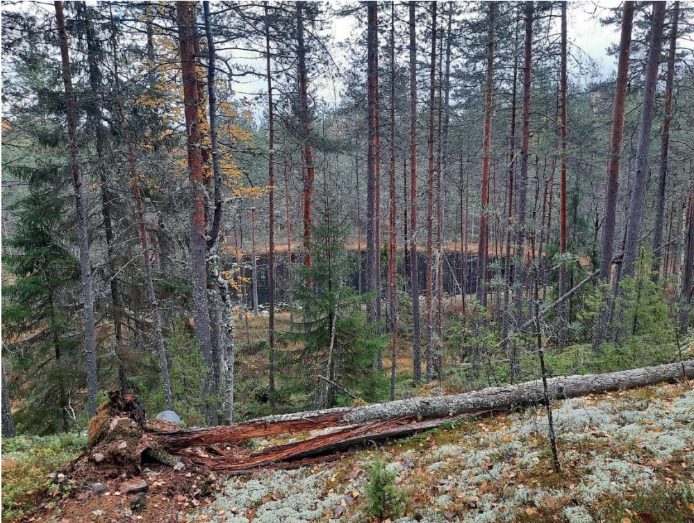
Silmälammi kalliolta kuvattuna.