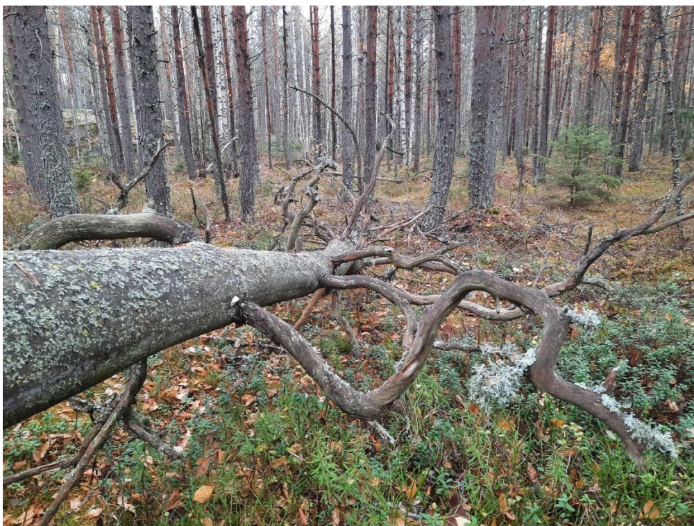
Hirvilammin itäpuoleista metsää.