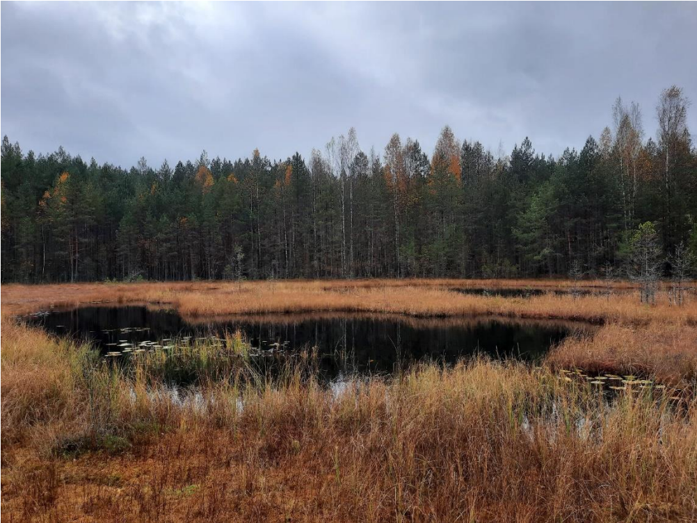
Alueen länsiosassa sijaitseva Nimetön.