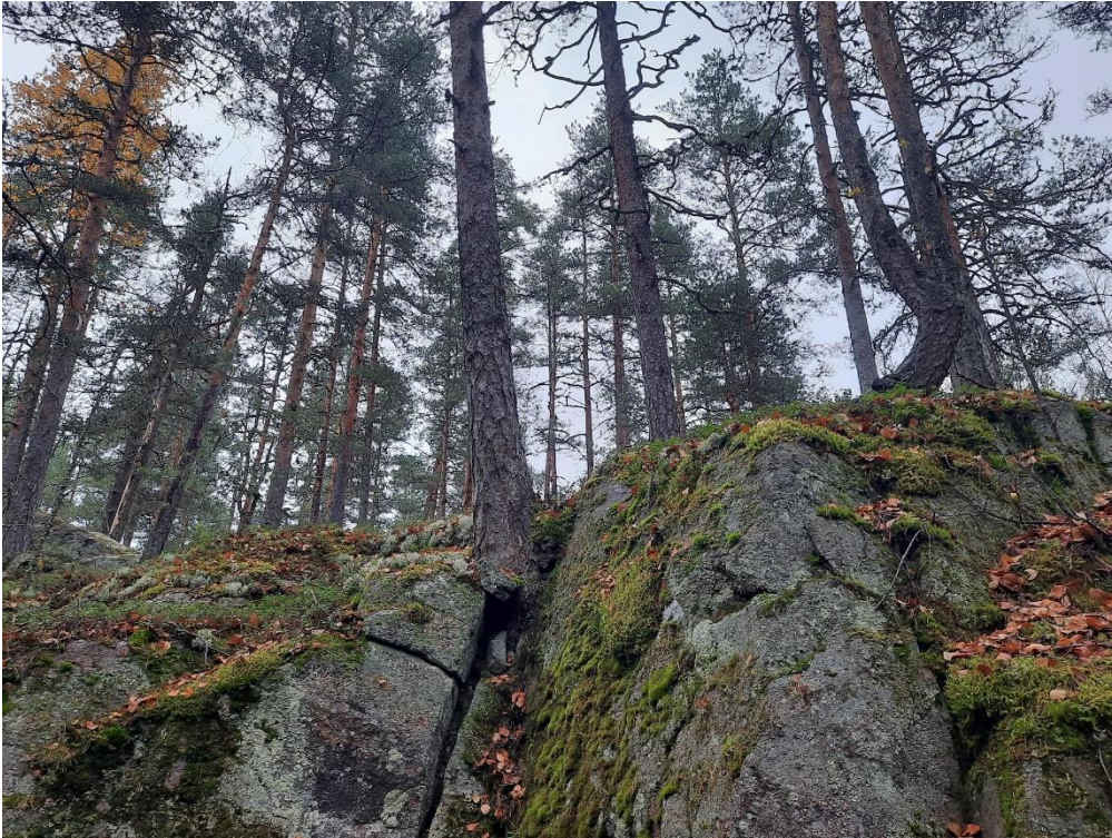
Kalliokieleke alueen pohjoispäässä.