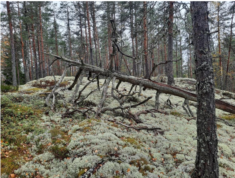
Kalliometsää Hirvilammin ja Nimettömän välissä.