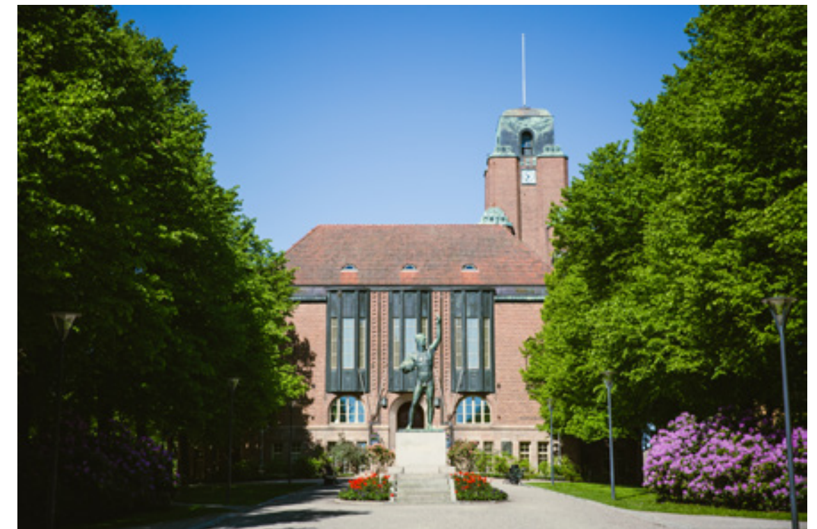
Kaupungintalossa on alkamassa mittava peruskorjaus.

Ylimmät oikeusvalvojat edustavat korkeaa lainopillista tietämystä ja asiantuntemusta. Tästä syystä heidän päätöksiinsä on suhtauduttava asianmukaisella vakavuudella ja huomioitava ne omassa toiminnassa. Lisäksi tarkastuslautakunta kiinnittää kaupunginhallituksen huomiota ylimmiltä oikeusvalvojilta Lahden saamien huomautusten suureen määrään suhteessa kunnallisviranomaisille koko maassa annettuihin huomautuksiin. Hallinnon uskottavuus edellyttää huomautusten määrän merkittävää pientymistä. Tämä vaatii tarkastuslautakunnan mielestä hallinnon itsearviointia ja työtapojen tarkistamista.