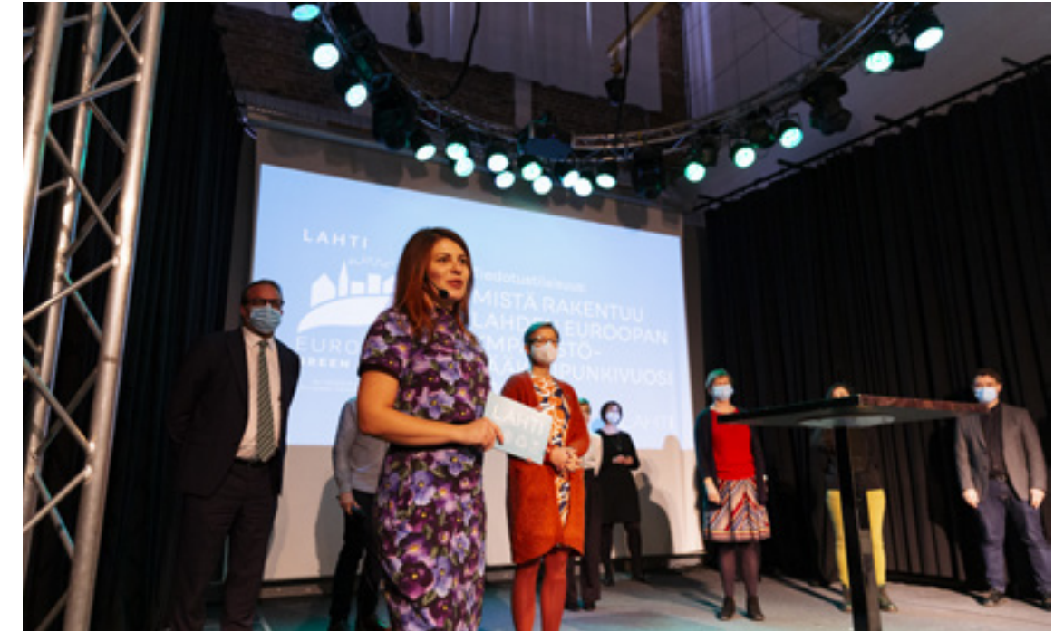
Lahti on Euroopan ympäristöpääkaupunki vuonna 2021. Hankkeessa haetaan pitkäkestoisia ympäristövaikutuksia.

Tarkastuslautakunta toteaa, että Lahden kaupungin maine yrittäjätävällisenä kuntana on kehittynyt viime vuosina parempaan suuntaan. Yrityspalvelusetelit ovat olleet yksi oiva keino osoittaa tukea yrittäjille. Korona on kurittanut monia pienyrittäjiä myös Lahdessa, jolloin pienikin rahallinen tuki voi olla elintärkeä.