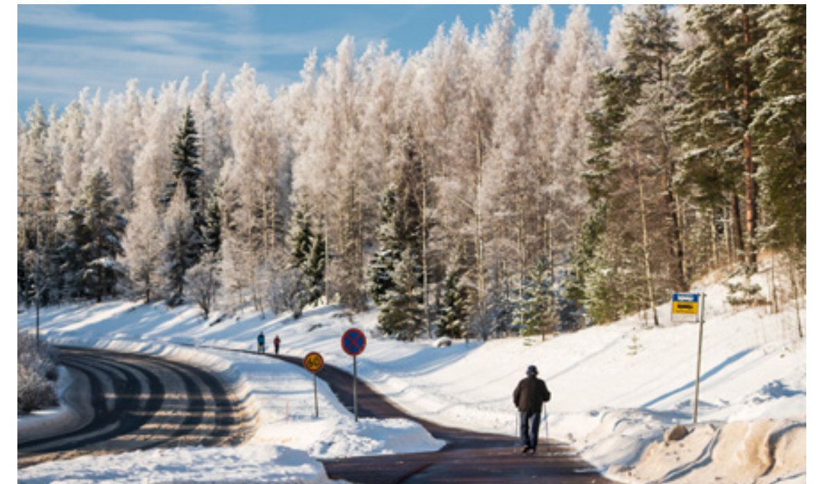
Formiaatti-yhdisteellä sulatetut ja puhtaaksi harjatut kevyenliikenteen väylät olivat mukavia kulkea. Kääntöpuolena oli puhtaanapidon noussut hinta sekä kenkien, pyörien ja koirien likaantuminen.