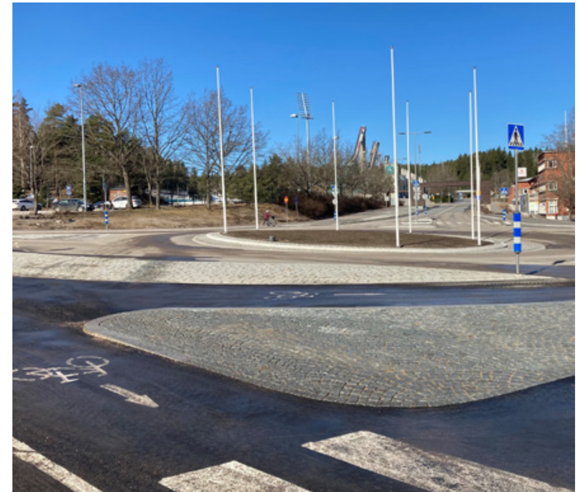
Urheilukeskuksen liikenneympyrä uusittiin siten, että nyt myös pyöräilijät kiertävät ympyrässä. Suomessa vastaavanlainen järjestely on Lahden lisäksi toteutettu vain Joensuussa. Muutoksen kustannukset olivat 480 000 euroa. Uudet liikennejärjestelyt ovat jakaneet kaupunkilaisten mielipiteitä ja vaativat totuttelua.

Tarkastuslautakunta toteaa, että vaikka yritystonttien luovutusta ja tonttivarantoa koskevat määrätavoitteet eivät varsinaisesti toteutuneet, on yrittäjien tonttipolitiikan hoitamisessa kuitenkin onnistuttu hyvin. Kaupungin on jatkossakin tärkeää pitää monipuolista tonttitarjontaa erilaisten yritysten tarpeisiin. Kehätie on tuonut Pippo-Kujalan yritysalueen valtakunnallisestikin aivan paraatipaikalle. Kaupungin tulee kaikin keinoin hyödyntää kehätien myötä avautuneet mahdollisuudet.