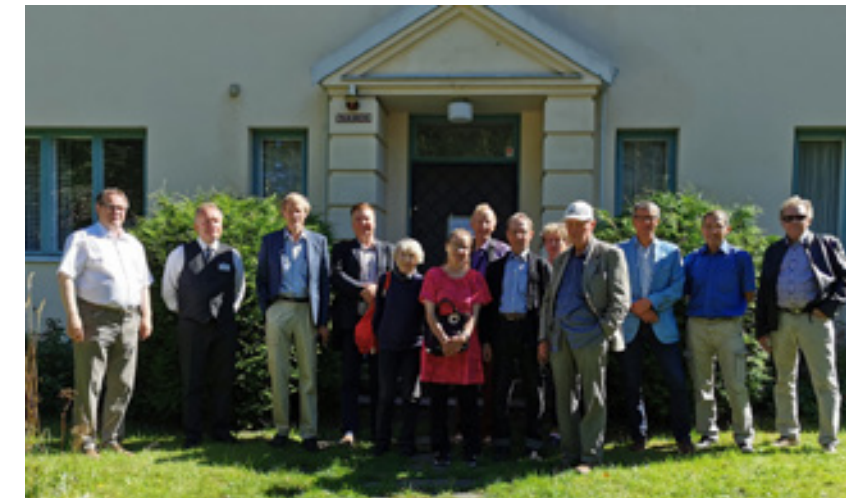
Tarkastuslautakunta vierailulla elokuussa UKK-arkistossa Orimattilan Niinikoskella.

Tarkastuslautakunnan jäsenten arviointikertomuksen laadintaa koskevat esteellisydet on esitetty liitteessä 1.