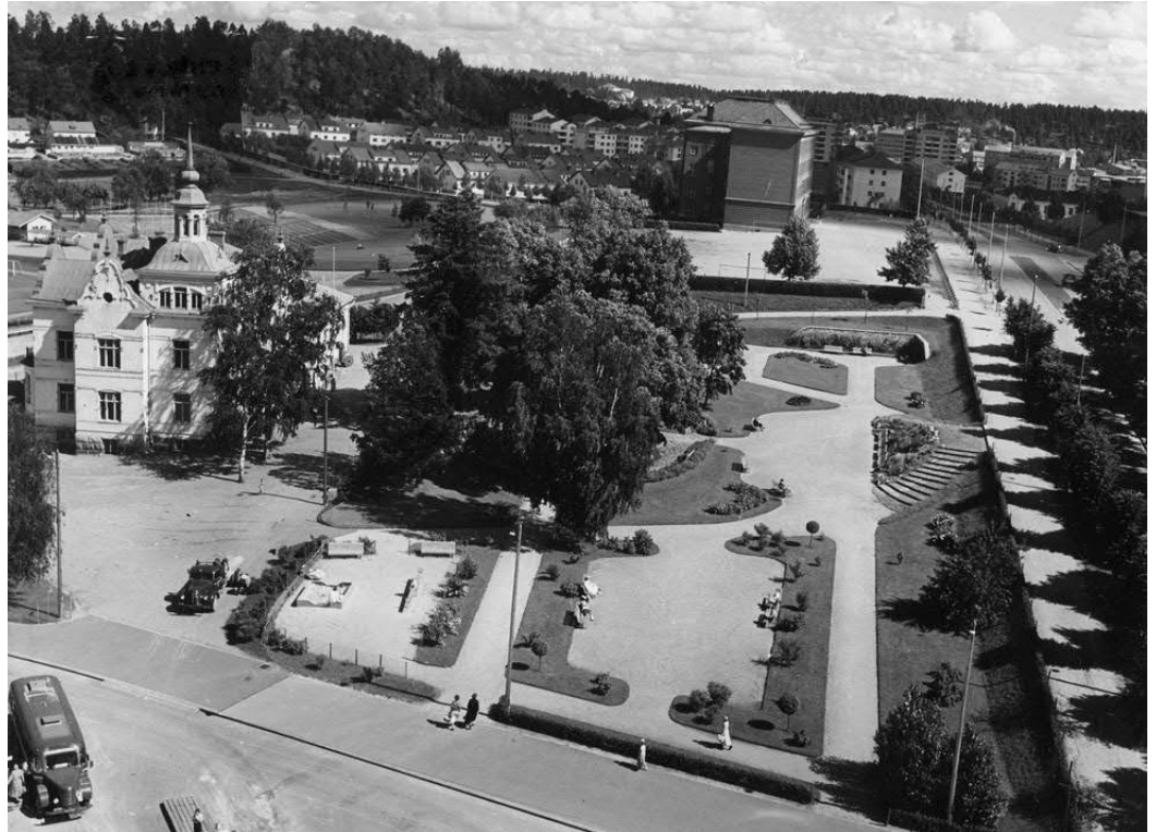
Kuva 1. Lahden kartanon puisto 50-luvulla

Edellä mainitun puistosuunnitelman toteutumisesta on kulunut 70 vuotta. Museon tontin rajat ovat siirtyneet viereisten katujen ja huoltoreitin tuomien muutosten takia. Käytäviä ja hiekka-aukioita on poistettu ja niiden tilalle on istutettu puita, tosin ilman varsinaista kokonaissuunnitelmaa. Muutoksen kuvaus on varsin tuttu monen kaupunkipuiston kohdalla Suomessa.