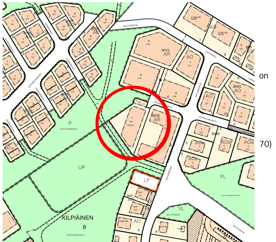
Ote Ajantasa-asekavasta (28.2.2020).