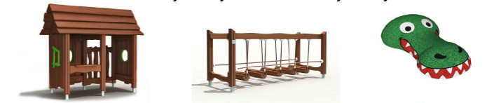
10. Leikkimökki 11. Tasapainoväline 12. Leikkifiguuri