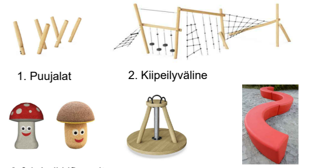
1. Puujalat 2. Kiipeilyväline 3.&4. Leikkifiguurit 5. Karuselliväline 6. Penkki, oranssi