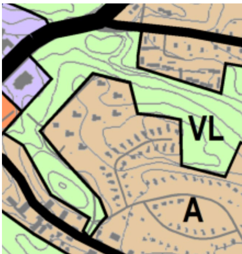
Yleiskaava (Y-205) kartta 1: kestävä yhdyskuntarakenne

Suunnittelualue on asuinalue (A). Asuinalueen ympäröi lähivirkistysalueet (VL)