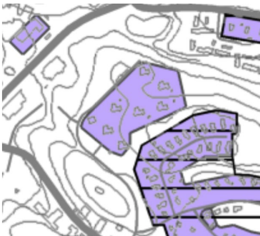
Yleiskaava (Y-205) kartta 2: kulttuuriympäristö

Suunnittelualue on asuinalue (A). Asuinalueen ympäröi lähivirkistysalueet (VL)