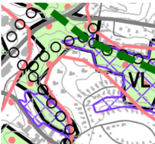
Yleiskaava (Y-205) kartta 3: luonto- ja viherympäristö

Suunnittelualue on paikallisesti arvokas rakennettu kulttuuriympäristö. Kulttuurihistoriallisesti arvokkaaseen rakennettuun ympäristöön tai sen läheisyyteen kohdistuvat muutokset tulee suunnitella alueen arvoa kunnioittaen ja ominaispiirteitä vaalien.