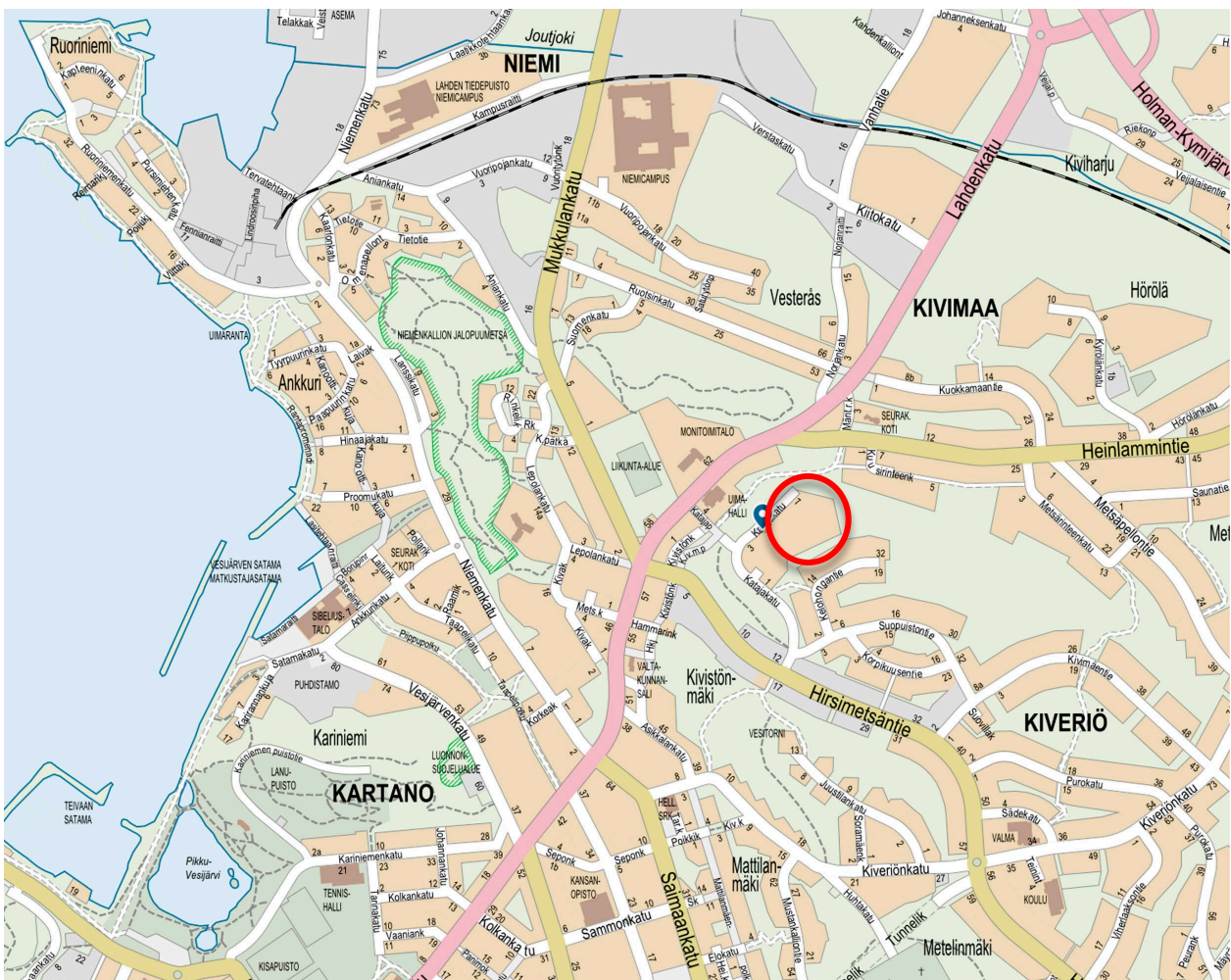
Kuva 1 Kaavakohteen sijainti opaskartalla.

Suunnittelualue sijaitsee Kivimaan (6) kaupunginosassa. Alue ja sen viisi 7-kerroksista asuinkerrostaloa rajautuvat pääosin luonnontilassa säilytettävään puistoalueeseen. Lounaassa suunnittelualue rajautuu kahteen Katajakadun vastaavaan 7-kerroksiseen asuintaloon. Suunnittelualueen etäisyys Lahden torilta on noin 1,6 km. Suunnittelualueen pinta-ala on noin 2,3 ha.