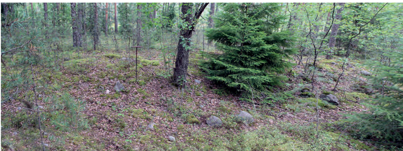
Lidark-kartassa erottuva ”rakenne” = sähkölinja (merkitty paaluin maastoon). Kuva lounaasta.