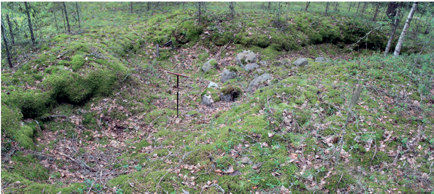
Rakenne suunnittelualan länsiosassa. Kuva koillisesta.